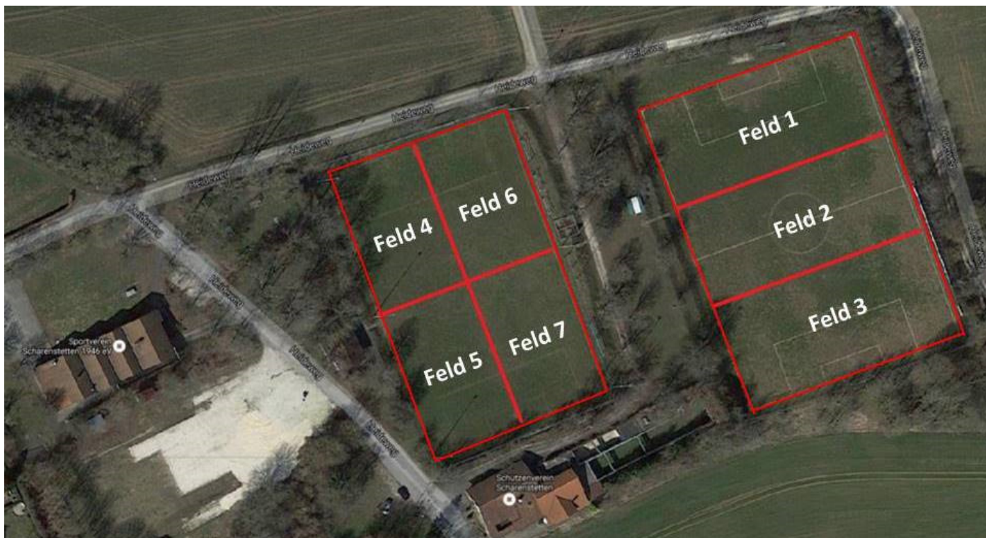
Abbildung 1: Zoneneinteilung Sportplätze Scharenstetten