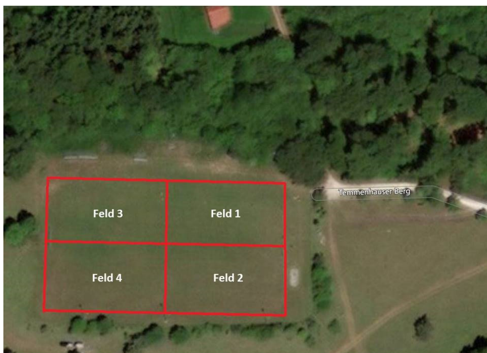
Abbildung 2: Zoneneinteilung Sportplatz Temmenhausen